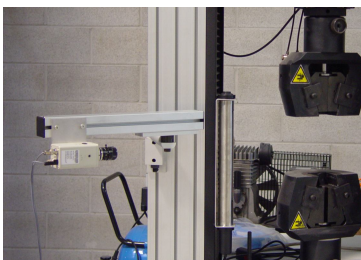
Estensimetro elettronico (base di misura 50 mm; sensibilità 1 \mu m)