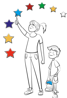
Painting our future together

La Regione del Veneto , U.O. Cooperazione Territoriale e Macrostrategie Europee, è Punto di Contatto Nazionale per il Programma Interreg CENTRAL EUROPE . Il Programma mette a disposizione 246 milioni di euro di Fondi FESR per la cooperazione transnazionale tra nove Paesi UE dell'Europa Centrale (Austria, Croazia, Repubblica Ceca, Germania, Ungheria, Italia, Polonia, Slovacchia e Slovenia) e ha già finanziato 85 progetti coinvolgendo più di 900 partner. Questo evento, in collaborazione fra Regione del Veneto e Università Iuav di Venezia , presenterà i risultati di metà periodo del Programma Interreg CENTRAL EUROPE e degli altri Programmi di CTE in corso di realizzazione nel Veneto, e fornirà le prime informazioni sugli scenari della Programmazione CTE per il 2021-2027.