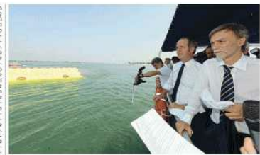
Il ministro Delrio con i funzionari del Consorzio Mose.

VENEZIA I problemi cronici, non risolvendo, «La difficoltà delle imprese, del Consorzio e così via sono tutte questioni che i commissari stanno cercando di affrontare e spero risolvano», dice il ministro delle Infrastrutture Graziano Delrio. Ma non per questo si vanta: «La speranza di raggiungere l'obiettivo della scadenza dell'anno è un programma, non un risultato. L'obiettivo è quello di dare un contributo a favore delle imprese, di riprendere il lavoro in maniera più efficace», aggiunge Delrio. «Chiediamo alle imprese di accelerare, perché voglio che quella scadenza sia rispettata. Parlo un po' più ottimisticamente di quelle che lavorano alle opere pubbliche, che le imprese private», dice il ministro.