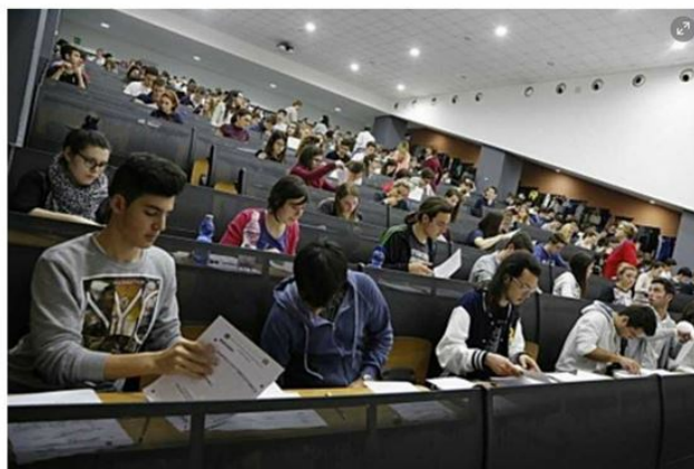
L' eccellenza universitaria italiana "abita" ancora al Nord. Ma l' area centro-meridionale del Paese tenta di difendersi con delle punte di diamante che fanno diventare alcune città quasi