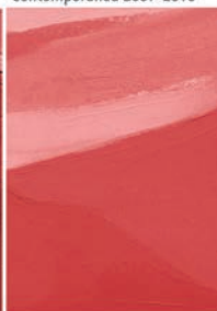
Storia e restauro Studi, ricerche, tesi