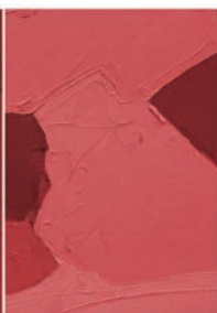
Insegnare il design della moda