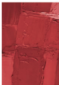
Abitare la città Istanbul Theatrum mundi