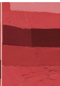
Immagini, rappresentazioni Metamorfosi migrazioni ombre