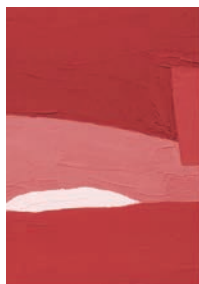
Il paesaggio nel progetto Il paesaggio come progetto