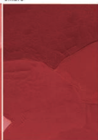
Interazione e Cognizione