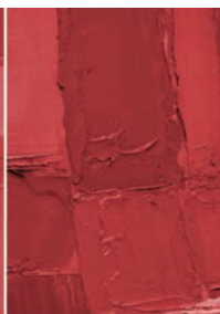
Strategie della memoria Architettura e paesaggi di guerra