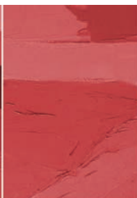
Esercizi di postproduzione