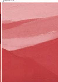
Durabilità - Longue durée