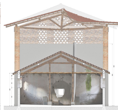
SEZIONI SULLA PORCILAIA