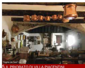
5. IL PRIORATO DI VILLA PIACENTINI