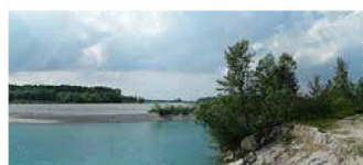
4. SULL'ARGINE DEL TAGLIAMENTO