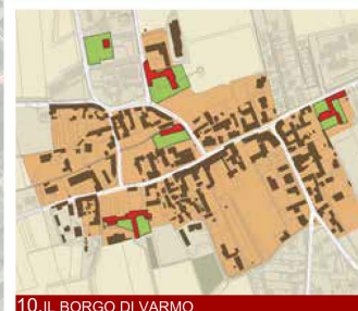
10. IL BORGO DI VARMO