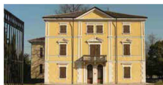
1. VILLA GIACOMINI (INFO POINT) A VARMO