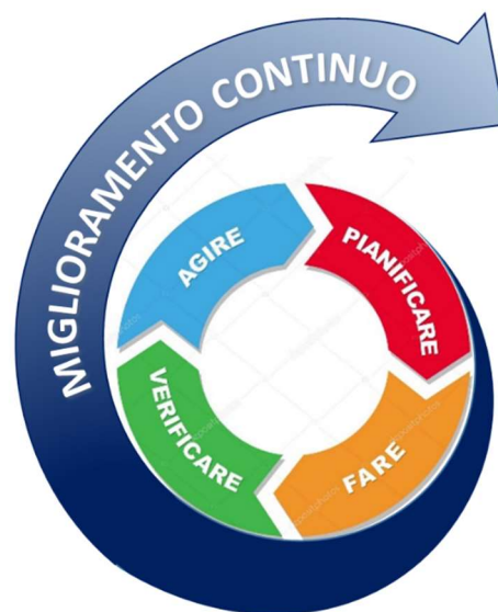
FIG. 1 – CICLO DI DEMING

Studiare i risultati misurati e raccolti nella fase del "attuazione" confrontandoli con i risultati attesi. Confrontarli poi con gli obiettivi della "pianificazione" per verificarne le eventuali differenze; quindi cercare le deviazioni riscontrate nell'attuazione del piano e focalizzarsi sulla sua adeguatezza e completezza per consentirne l'esecuzione.