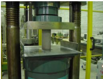
Calcestruzzo: compressione diretta