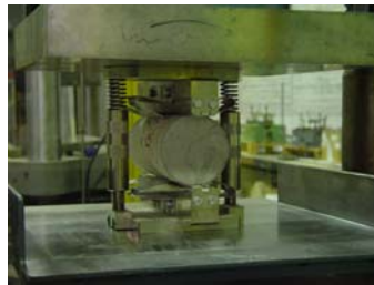
Calcestruzzo: compressione indiretta "brasiliana"