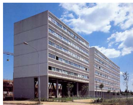
G. Polesello, Edificio residenziale IACP a Udine (1983-87), viste dell'edificio in linea,